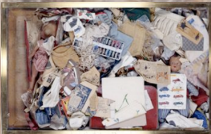
«Poubelle des enfants» Sculpture de ARMAN

On fait aussi de la musiques avec de vrais instruments !