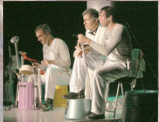
Les poubelles boys

Je connais l'homme qui a vu l'homme Qui s'est baigné dans une rivière Dans une eau claire, fallait voir comme Plus claire encore que la lumière J'vous parle de ça, y'a un paquet Les p'tits ruisseaux étaient courants Chacun avait son robinet Les enfants jouaient dans les étangs. Extrait de «Rupture de stock» de Richard Gotainer