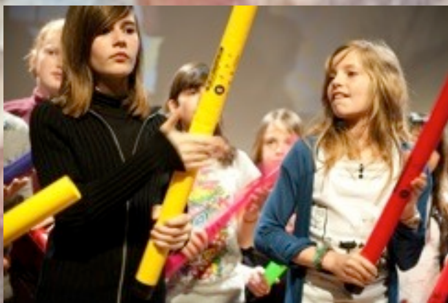
Des tubes en plastiques