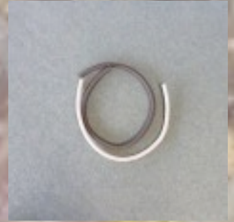
De la gaine électrique

Je connais l'homme qui a vu l'homme Qui s'est baigné dans une rivière Dans une eau claire, fallait voir comme Plus claire encore que la lumière J'vous parle de ça, y'a un paquet Les p'tits ruisseaux étaient courants Chacun avait son robinet Les enfants jouaient dans les étangs. Extrait de «Rupture de stock» de Richard Gotainer